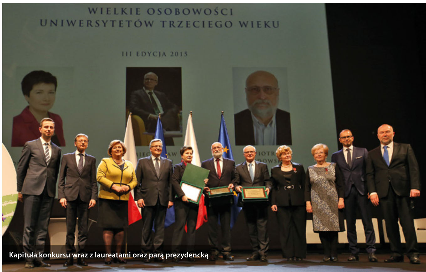
Kapituła konkursu wraz z laureatami oraz parą prezydencką

- wybitnym postaciom, które swoją działalnością szczególnie przyczyniły się do rozwoju ruchu Uniwersytetów Trzeciego Wieku oraz poprawy statusu osób starszych. W gronie laureatów znalazła się także prezydent Warszawy - Hanna Gronkiewicz-Waltz. Laureatami zostały osoby bardzo zasłużone w różnorodnej działalności zawodowej i społecznej, których aktywność przyniosła wiele do-