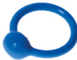
Pessar cewkowy

Pessary cewkowe (pessary pierścieniowe z kulistym zgrubieniem na okolicę cewki moczowej i z aluminiowym rdzeniem) wykonane są ze specjalnego, elastycznego materiału. Nitka do trzymania, kupiona osobno, może zostać przymocowana z obu stron kulki, co stabilizuje pessar pod cewką i ułatwia jego wyjęcie.