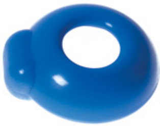
Pessar cewkowy kołnierzowy

Pomocny w leczeniu objawów pęcherza nadreaktywnego oraz nietrzymania moczu, współistniejących z wypadaniem pochwy i macicy. Jednak nie jest to typowy pessar do likwidacji objawów nietrzymania moczu.