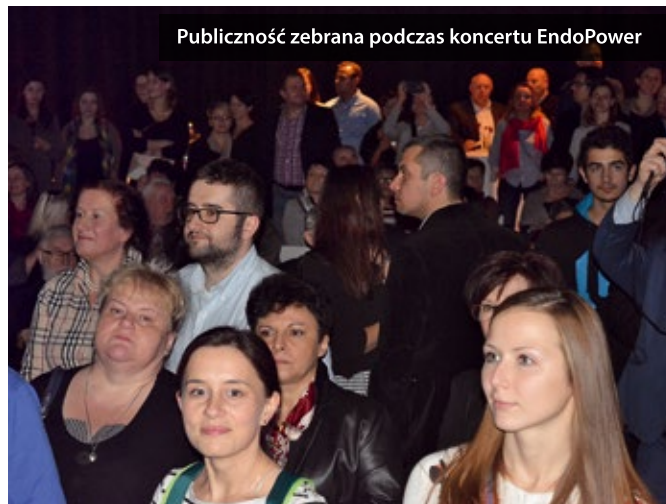
Publiczność zebrana podczas koncertu EndoPower

świadczeń i wiedzy chcą zachęcać środowisko do dyskusji na temat urologii i profilaktyki badań układu moczowego. W skład zespołu EndoPower - pomysłodawców Festi-