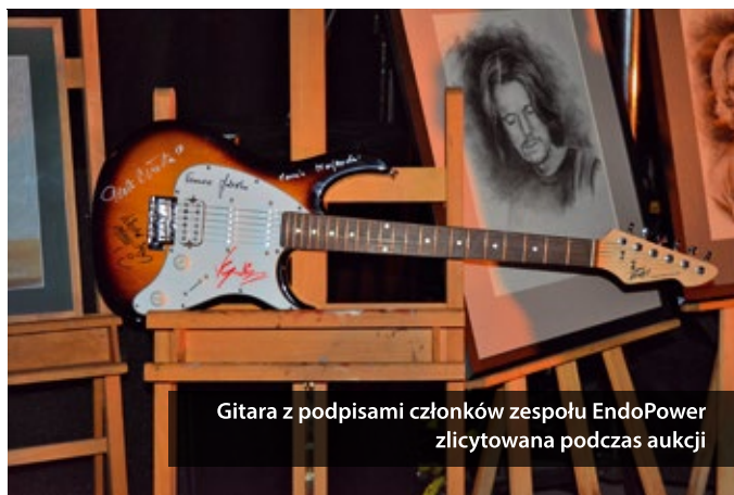
Gitara z podpisami członków zespołu EndoPower zlicytowana podczas aukcji